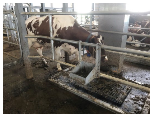
除菌効果や安全性を確立し実践的な導入へ