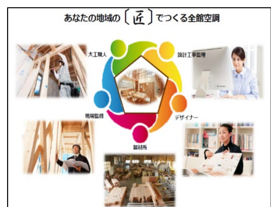
「匠」でつくる全館空調